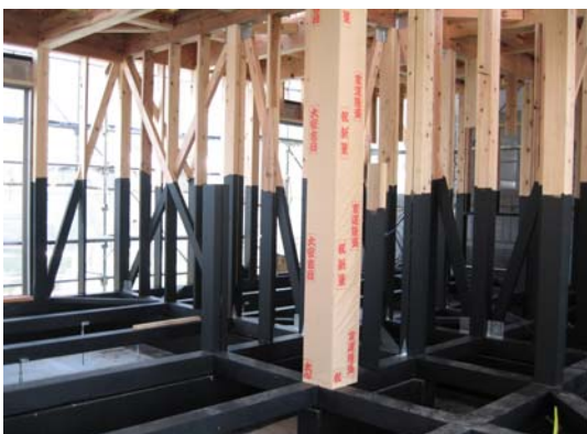
防蟻剤のヘルスコキュアー↑

防蟻剤に、化学薬品を一切使用しない木炭塗料を使用。シロアリの防虫効果はもちろん、調湿効果・土台と建物の腐食防止効果もあり、自然・無害・安全です。高品質で一般の防蟻剤の10倍の価格ですが、木麗な家では標準仕様です。